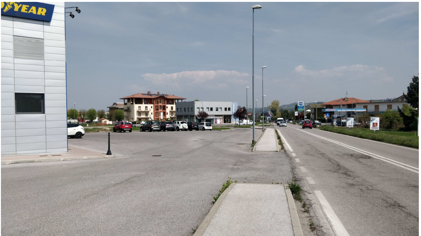
Fotografia n. 2 Veduta interna del Piano Esecutivo Convenzionato (P.E.C.) CR1113 da Via degli Artigiani.